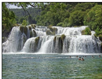
Krka - Wasserfälle