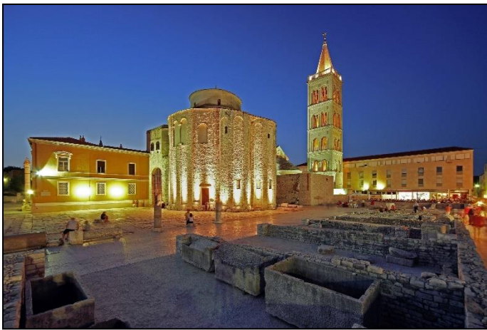
Zadar bei Nacht