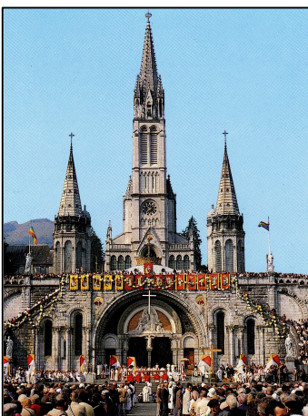
Basilika - Lourdes