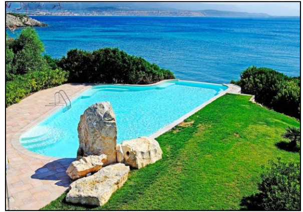
Panoramapool (Hotel Punta Negra)