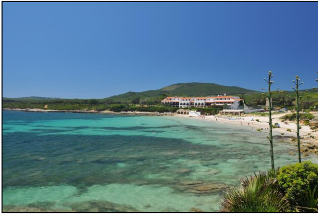
Blick auf das Hotel PUNTA NEGRA in Alghero