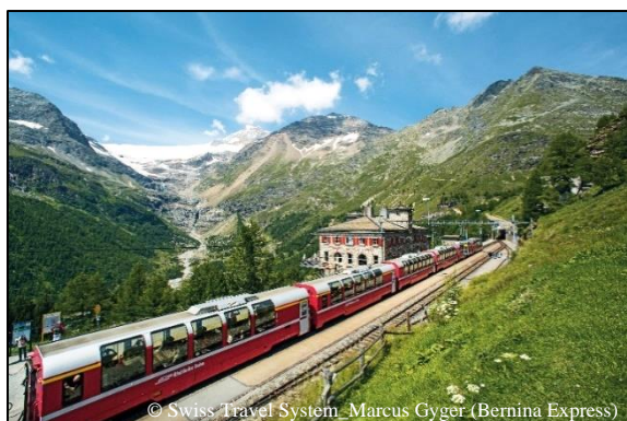
© Swiss Travel System_Marcus Gyger (Bernina Express)