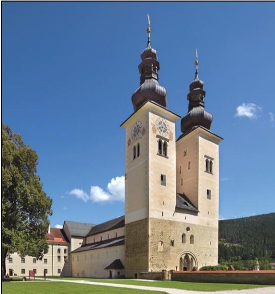
Dom Aussenansicht