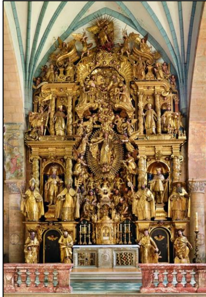
Hochaltar: © Kunstverlag Peda